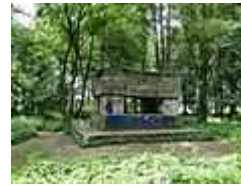
Cmentarz przy ul. Ostrowskiej.