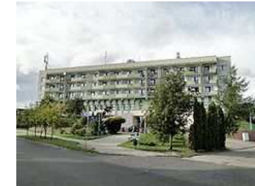
Dom Kombatanta im. M. Boruty Spiechowicza.