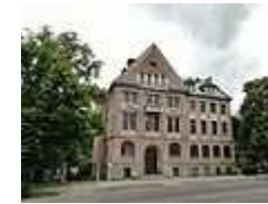
Dawny ratusz przy ul. Robotniczej 26.