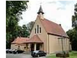
Kościół M.B. Ostrobramskiej.

Więcej informacji na stronie internetowej Wikipedii poświęconej Żelechowej: http://pl.wikipedia.org/wiki/%C5%BBelechowa